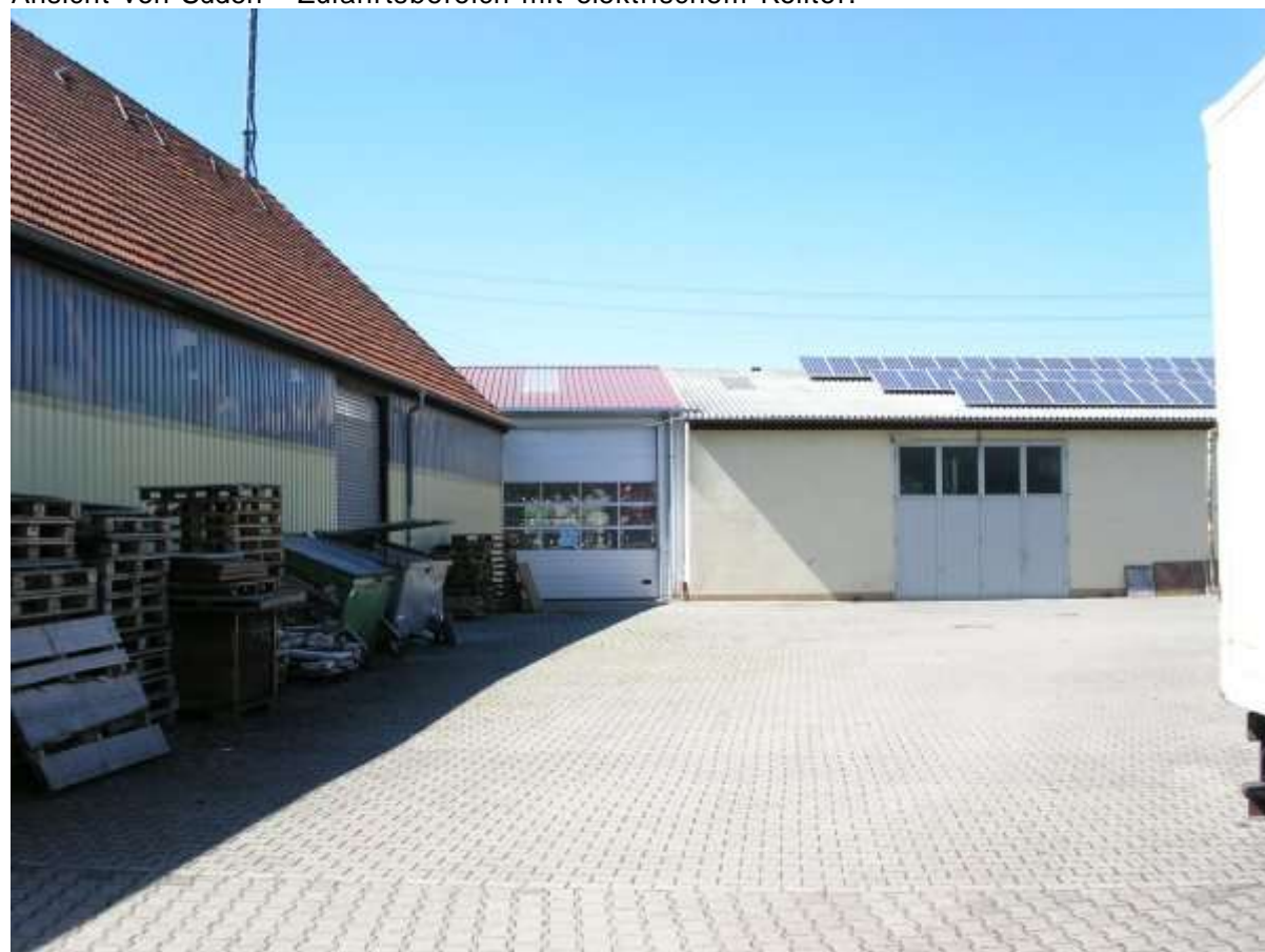
Ansicht von Westen - Zugangsbereich mit zweiflügliger Türe.